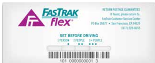
FasTrak® Flex Toll Tag

Los carriles expresos funcionan de lunes a viernes de 5 AM a 8 PM. Los carriles están abiertos a todos los vehículos durante las demás horas. Los vehículos que no respeten las reglas de los carriles expresos están sujetos a una multa por parte de la Patrulla de Carreteras de California.